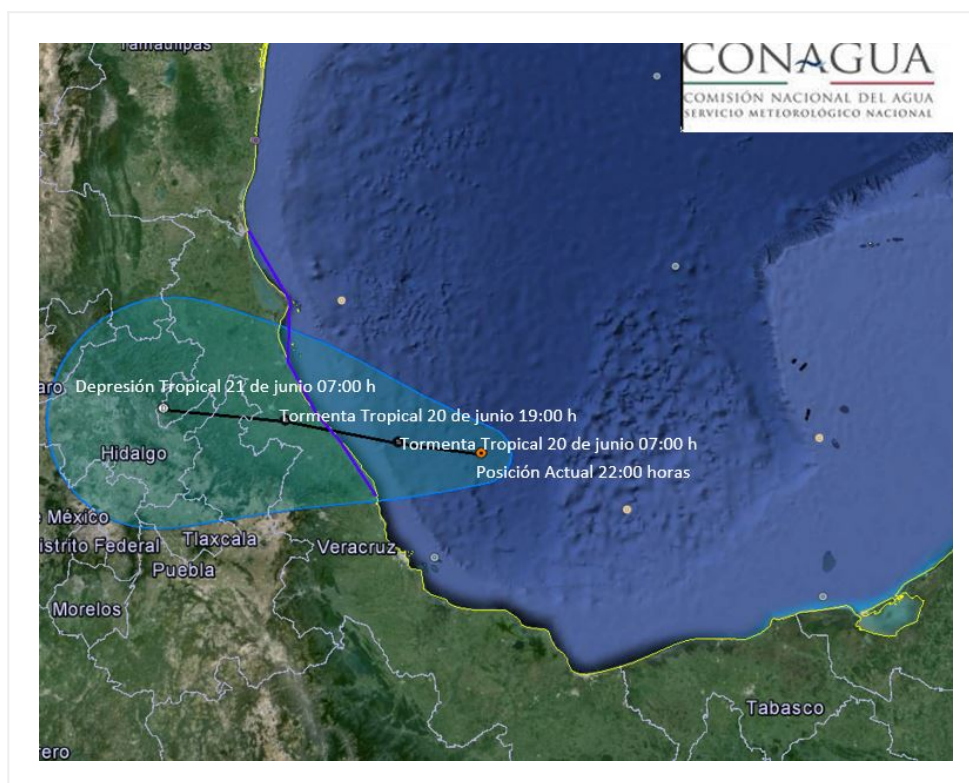
Imagen de trayectoria de la Depresión Tropical "Cuatro"